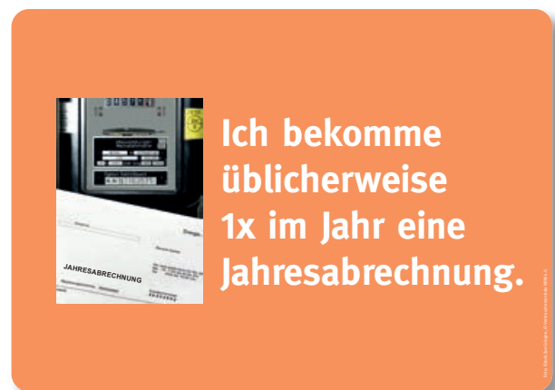
Abb. 4.1 Kernbotschaft 4 (Format: DIN A4)