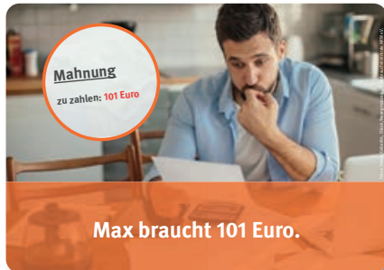
Abb. 6.1 Bildergeschichte „Max und die Stromsperre“ (5 Karten, Format: DIN A5)