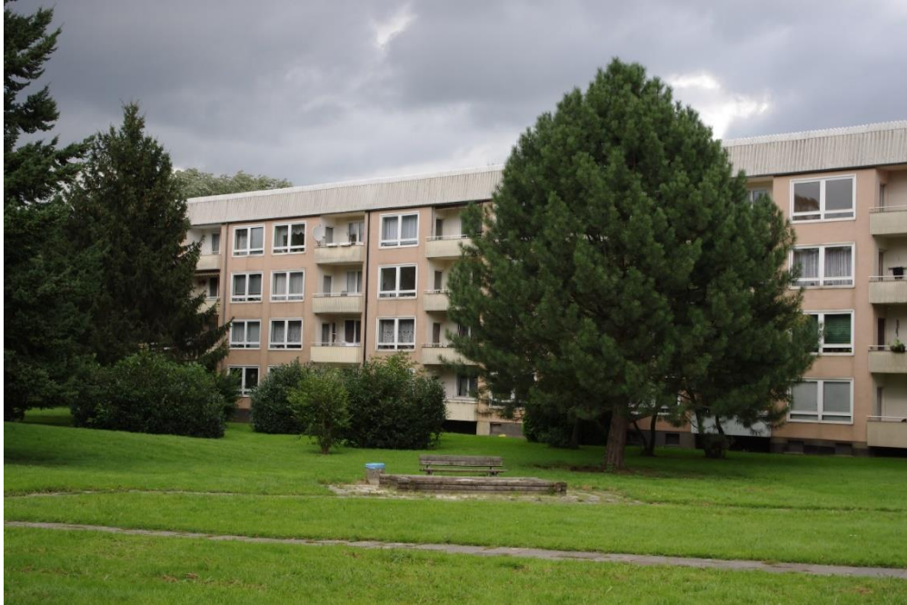
Siedlung Lanstrop

Allgemeines Desinteresse an Investitionen in den Bestand